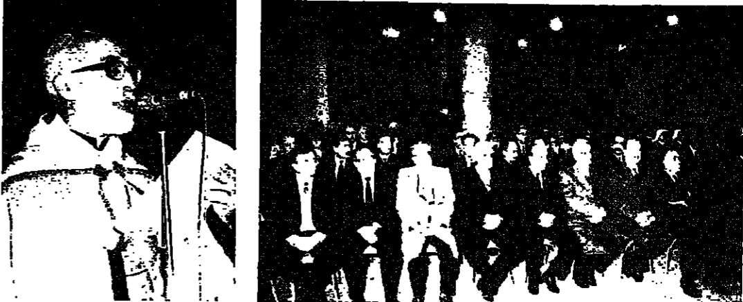
الحضور في القداس